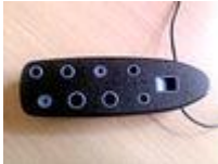
Ocarina "en línea" de policarbonato con 9 orificios.