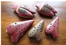
Grupo en primer plano "ocarinas dobles", al fondo variaciones de este modelo.