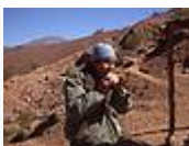
Artesano alfarero interpretando su ocarina en el valle de Las Conchas (Salta, Argentina).