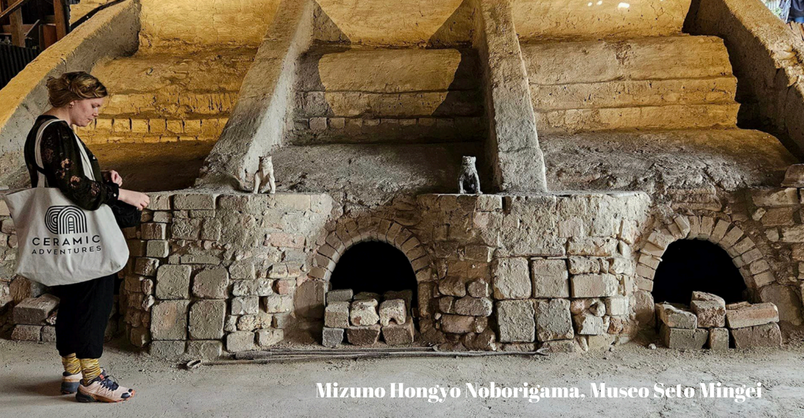
Mizuno Hongyo Noborigama, Museo Seto Mingei